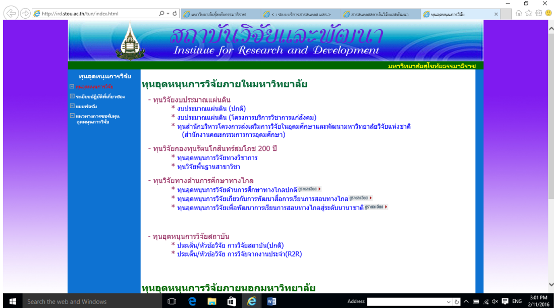
ภาพที่ 2.1 เว็บไซต์สถาบันวิจัยและพัฒนา