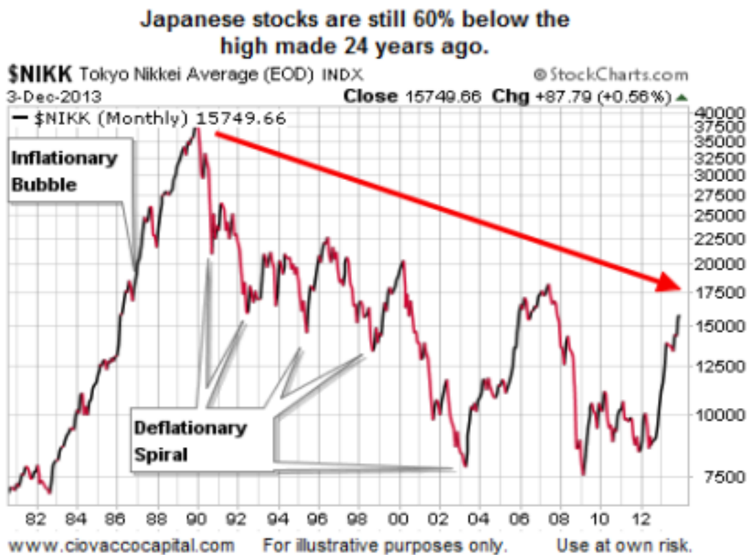
ภาพที่ 1 แสดงดัชนีตลาดหลักทรัพย์ NIKKEI ที่ลดลงอย่างต่อเนื่อง